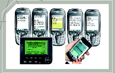
Saha Ekibi/Mobil Kullanıcı Arayüzleri

INFOTECH MOBILE & LOCATION BASED TECHNOLOGIES